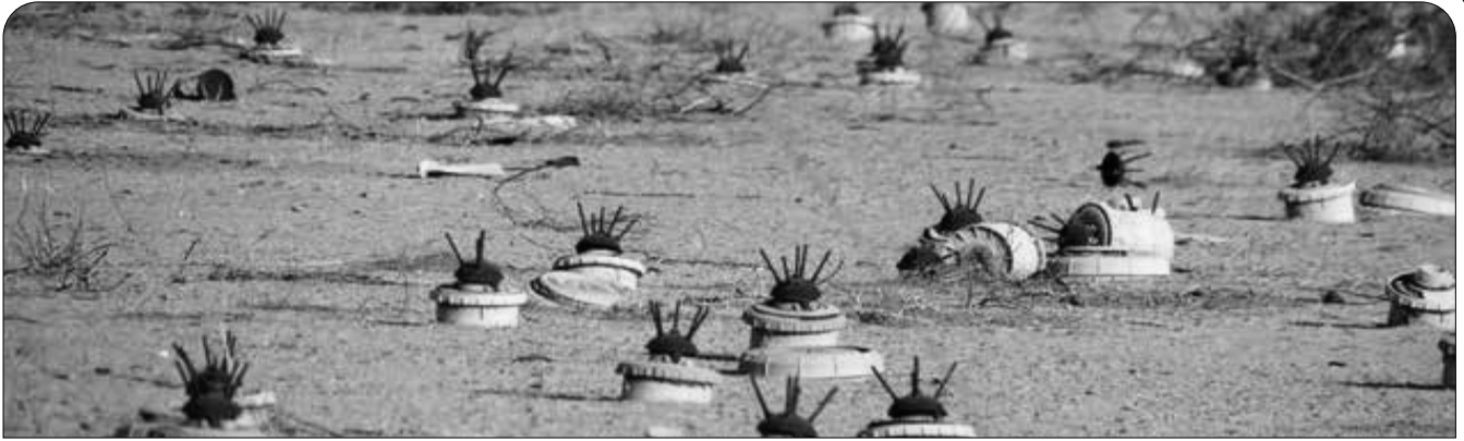
مشخصات شهروندانی که در سه ماهه بهار سال ۱۴۰۳ به علت انفجار مین کشته یا زخمی شده‌اند: