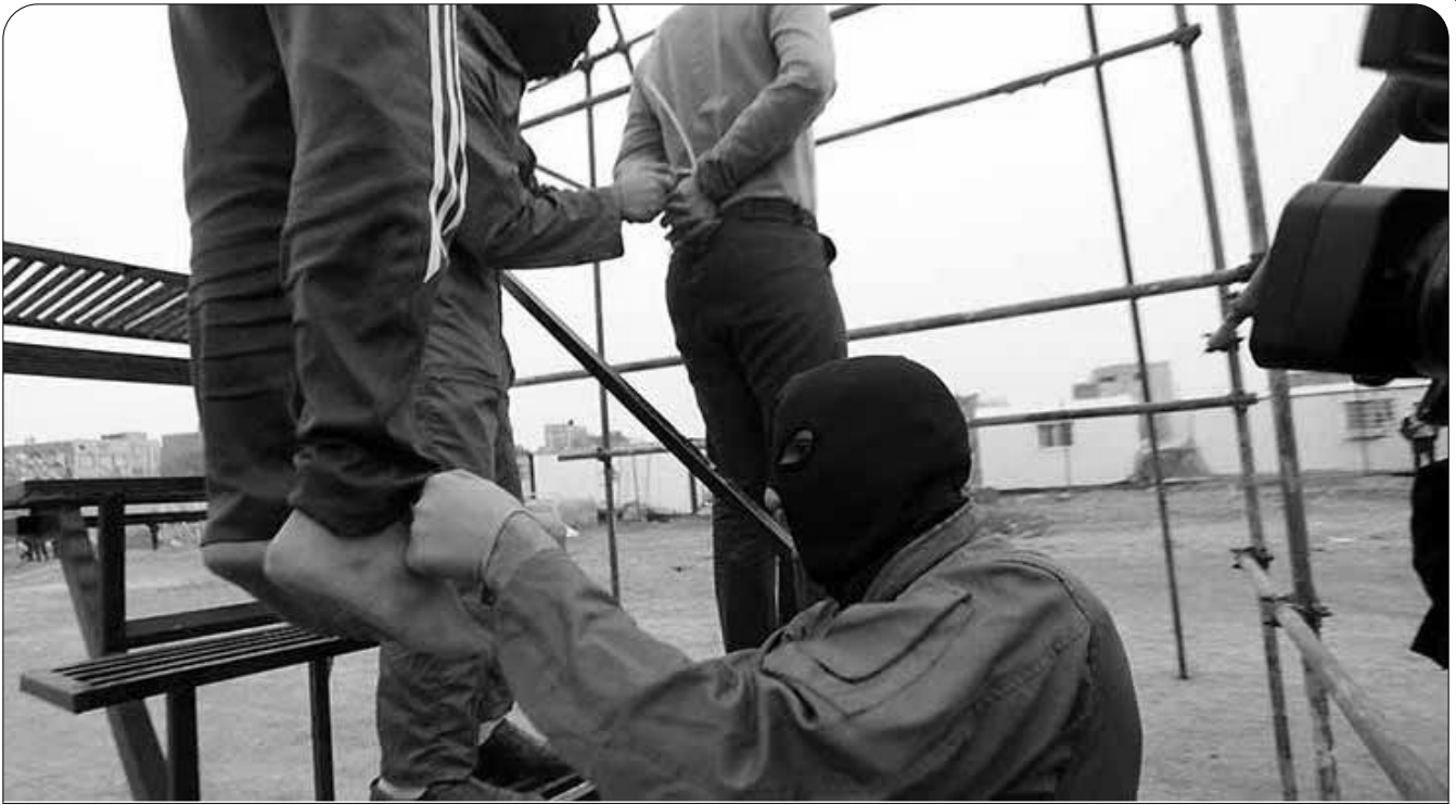
مشخصات زندانی‌هایی که طی فصل زمستان ۱۴۰۲، اعدام شده‌اند: