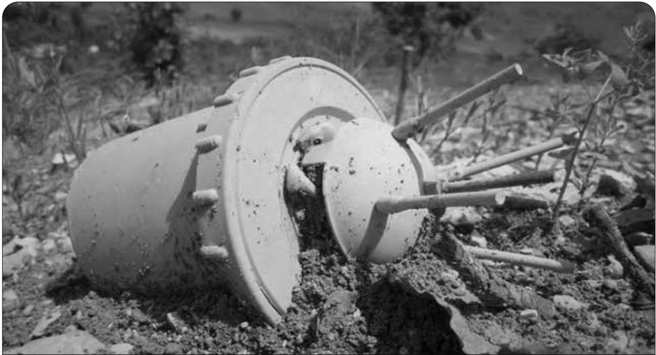
زانیاری لەسەر ئەو کەسانە ی لە سەن مانگی زستانی ۱۴۰۲ لە کوردستان بوونەتە قوربانیی تەقینەوهی مین