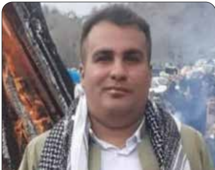
ھىمەن نىك پەى، چالاكى فەرھەنگىيى خەلگى گوندى «چۆر»، سەر بە شارى مەريوان، كە رۇژى ۲۹ رىبەندان لەلايەن ھىژە ئەمىنىيەتتىيە كانەوہ دەسبەسەر كرا.